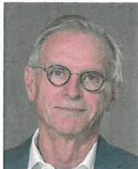
Wolfgang Panter, Präsident des Verbands Deutscher Betriebs- und Werksärzte