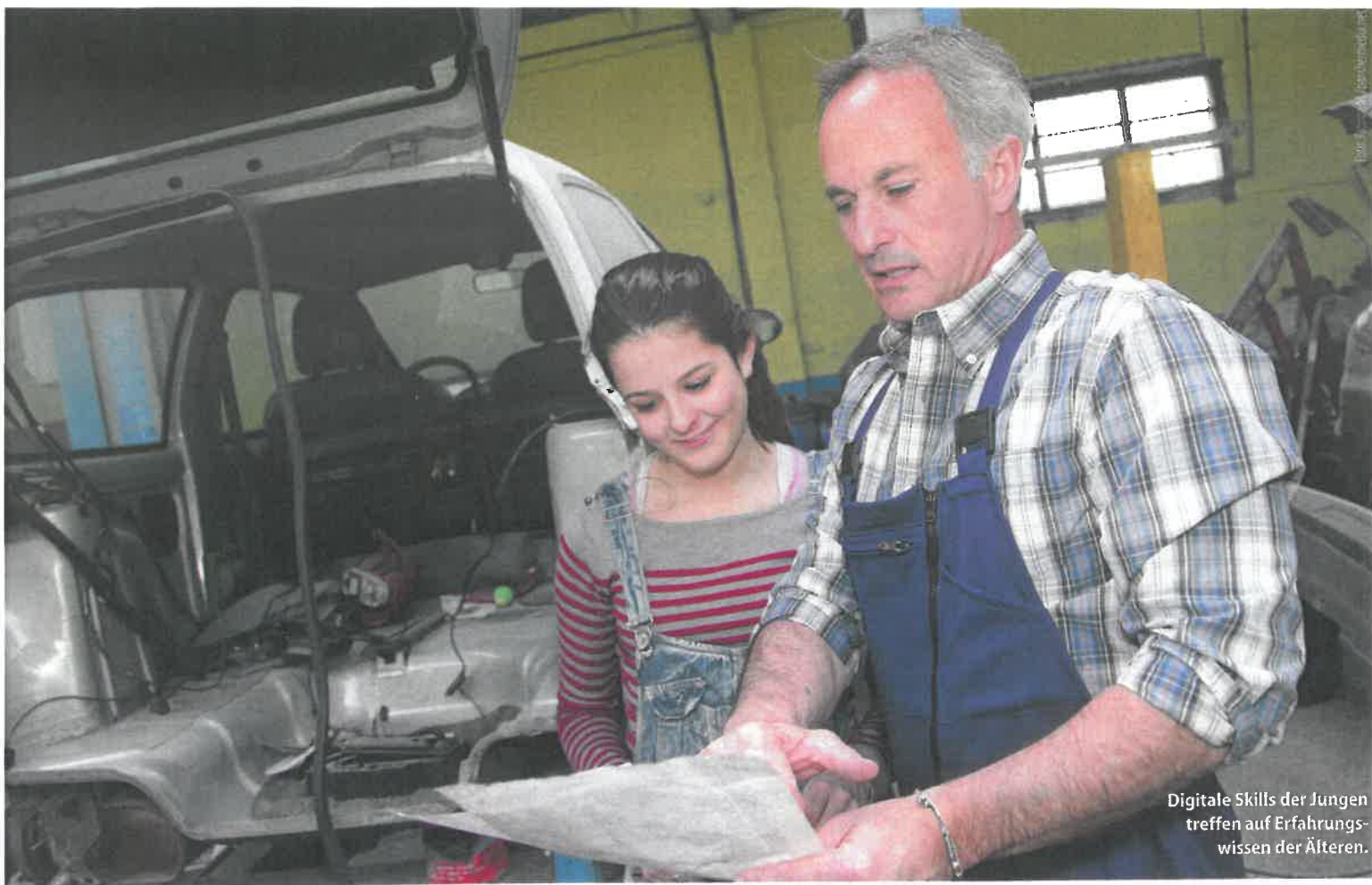
Digitale Skills der Jungen treffen auf Erfahrungswissen der Älteren.